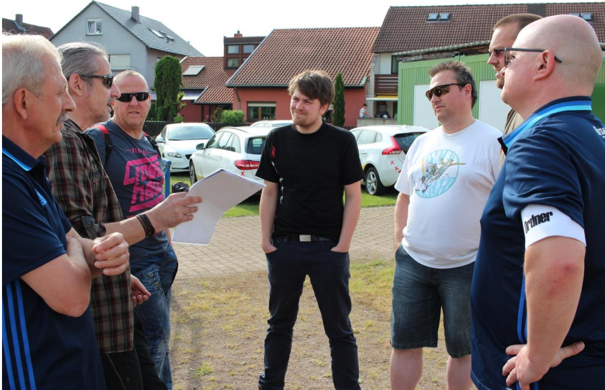
Vom Himmel hoch da kommt der Spielball her