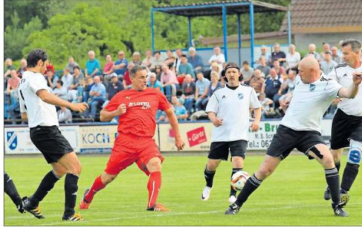
Das Ergebnis war zweitrangig: Am Ende stand es 8:1 für die Promis, hier im roten Trikot Stefan Kuntz.