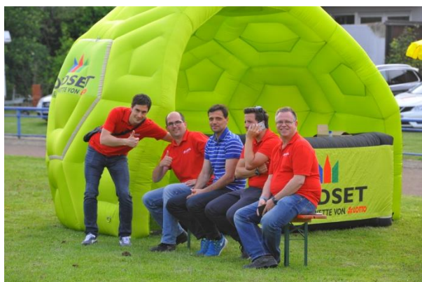
Peter Seydel (Lotto-Fotograf)