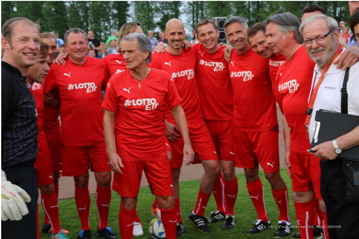
Die TuS AH Startformation: