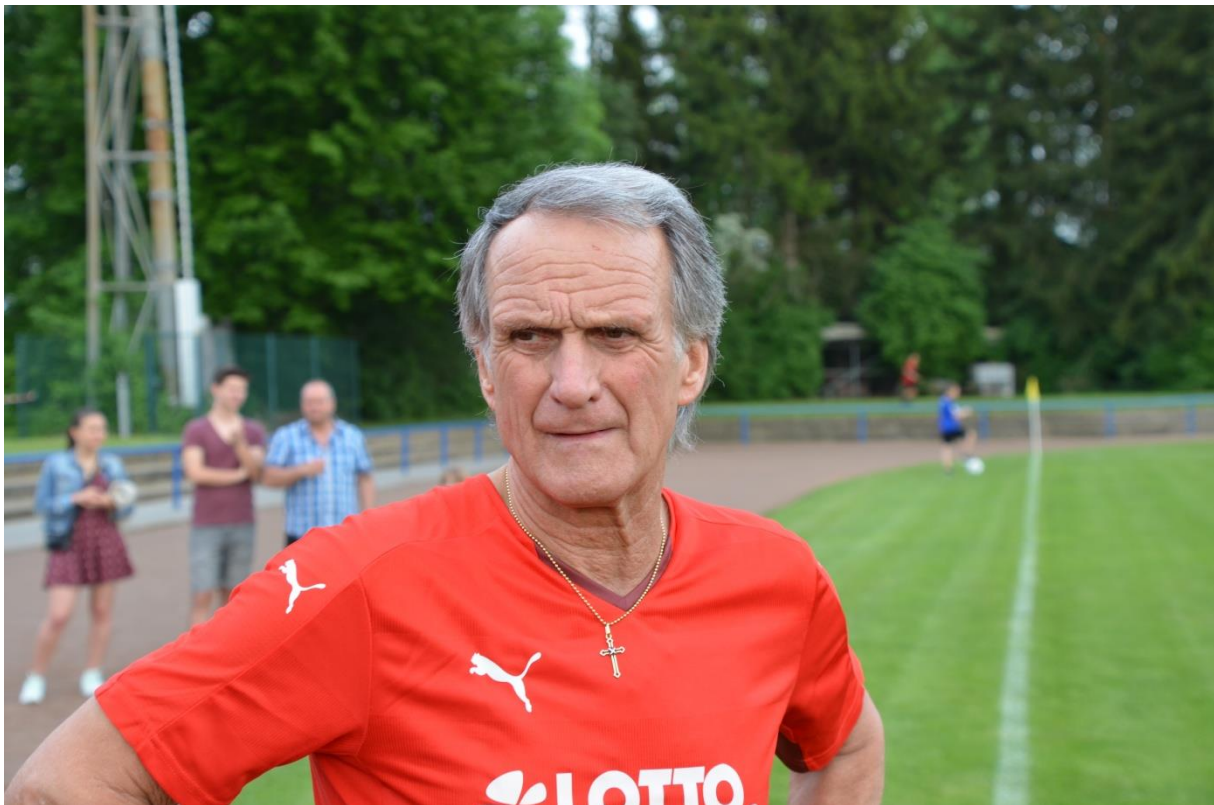
Wolfgang Overath immer noch mit brillanter Technik und Übersicht